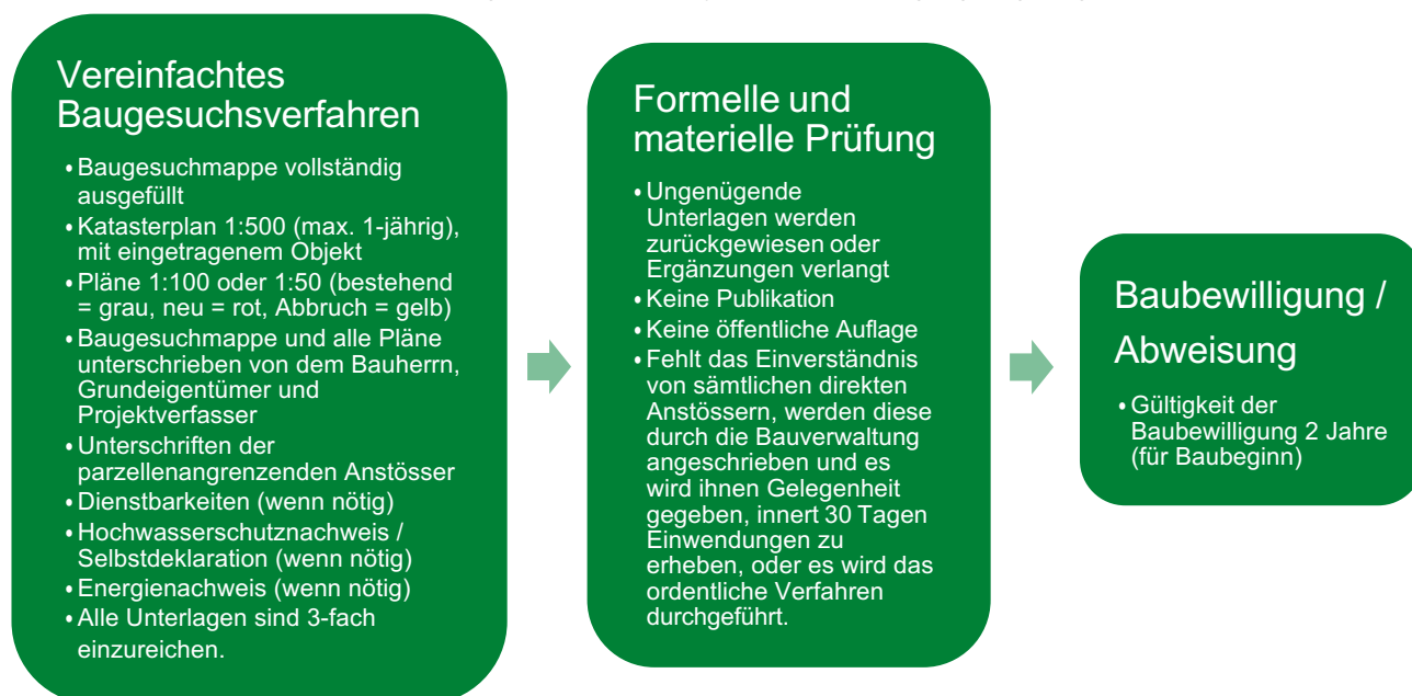
Abbildung 1: Ablauf und Vorgehen beim vereinfachten Baugesuchsverfahren

In der Grafik wird der Ablauf und das Vorgehen vom Bauprojekt bis zur Bewilligung aufgezeigt.